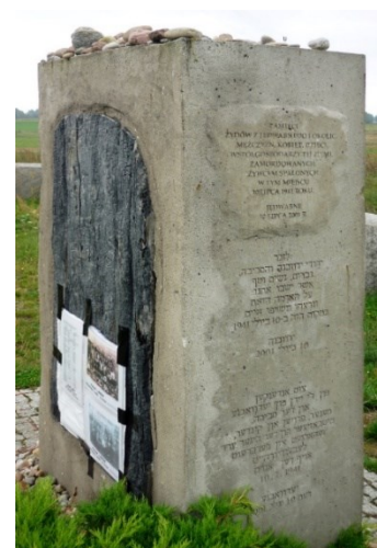
Minnesmärke i Jedwabne