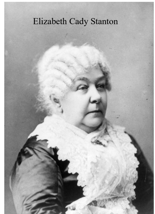
Elizabeth Cady Stanton

”Vi anser att dessa sanningar är självklara: att alla män och kvinnor är skapade lika; att de är begåvade av sin Skapare med vissa okränkbara rättigheter, att bland dessa finns liv, frihet och strävan efter lycka; (...) Mänsklighetens historia är en historia av upprepade skador och tillgrepp från mannens sida gentemot kvinnan, med direkt syfte att upprätta ett absolut tyranni över henne. För att bevisa detta låt oss uppvisa fakta till en uppriktig värld. Han har aldrig tillåtit henne att utöva sin okränkbara rätt till att välja sitt styre. Han har tvingat henne att underkasta sig lagar i vilkas bildande hon inte haft någon röst. Han har gjort henne, om hon är gift i lagens mening civilt död. (...) Nu, med tanke på hela denna rättslöshet från hälften av folket i detta land, deras sociala och religiösa förnedring. Med tanke på de ovannämnda orättvisa lagarna och eftersom kvinnor känner sig kränkta, förtryckta och berövande sina mest heliga rättigheter kräver vi att omedelbart få tillträde till alla rättigheter och privilegier som tillhör dem som medborgare i USA.”